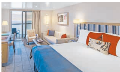
ペントハウス・ベランダ バルコニー・シャワー付客室