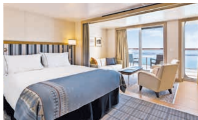
ペントハウス・ジュニアスイート バルコニー・シャワー付客室