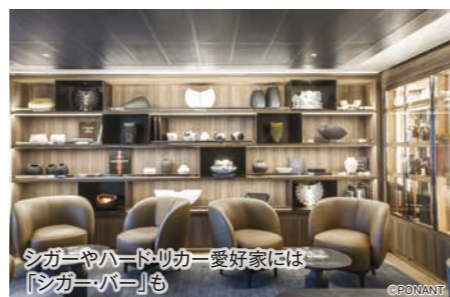
シガーやハードリカー愛好家には「シガーバー」も