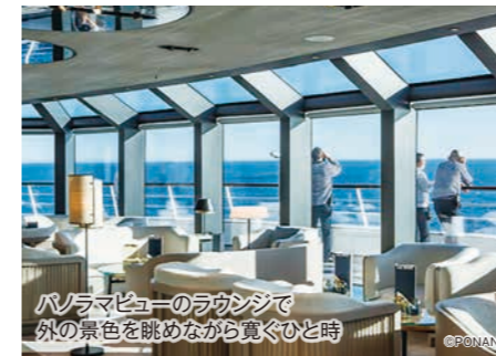
パノラマビューのラウンジで外の景色を眺めながら寛ぐひと時