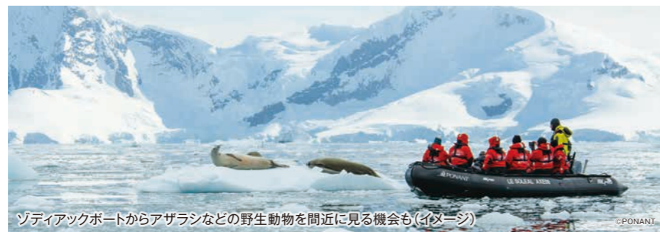
ゾディアックボートからアザラシなどの野生動物を間近に見る機会も(イメージ)

安全第一でエクスペディション・リーダーが丁寧にサポートしますので、はじめての方でも安心です。専用ボート(ゾディアックボート)に跨いで乗ることさえできれば、特別な体力がなくてもご参加いただけます。