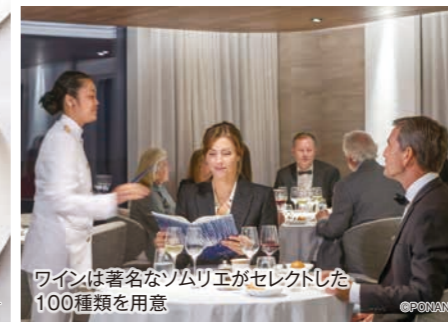
ワインは著名なソムリエがセレクトした100種類を用意