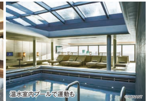
温水室内プールで運動も