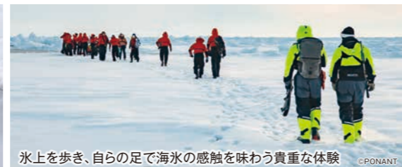
氷上を歩き、自らの足で海水の感触を味わう貴重な体験