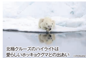
北極クルーズのハイライトは 愛らしいホッキョクグマとの出あい