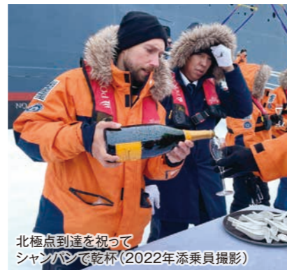
北極点到達を祝って シャンパンで乾杯(2022年添乗員撮影)