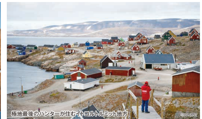
極地最後のハンターが住むイトコトルミット地方