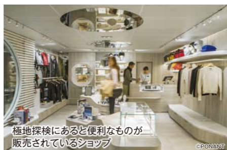
極地探検にあると便利なものが販売されているショッ