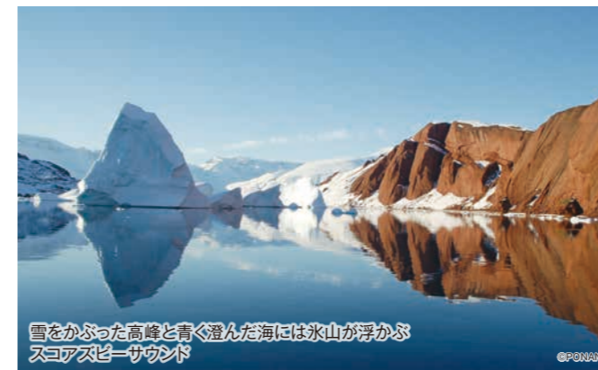
雪をかぶった高峰と青く澄んだ海には氷山が浮かぶ スコアズビーサウンド

北極点到達後はグリーンランドのフィヨルド、スコアズビーサウンドを船上から眺め、極地の過酷な自然のなかで暮らす人々の生活を垣間見ることができるイトコトルミット地方を訪れます。下船後は、アイスランドの大自然もお楽しみください。