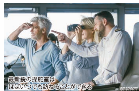
最新鋭の操舵室は、ほぼいつでも訪ねることができる

全客室 共通設備 ツインベッド、テレビ(VOD)、冷蔵庫、ミニバー、ネスプレッソコーヒーメーカー、金庫、空調、ドライヤー、バスローブ、ディブティックパリのバスアメニティ、液体石けん、シャンプー、コンディショナー、電話、BOSE Bluetoothスピーカー、室内スリッパなど