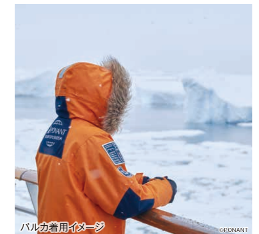
パルカ着用イメージ