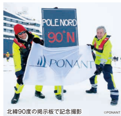
北緯90度の掲示板で記念撮影