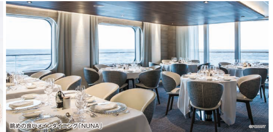
眺めの良いメインダイニング「NUNA」