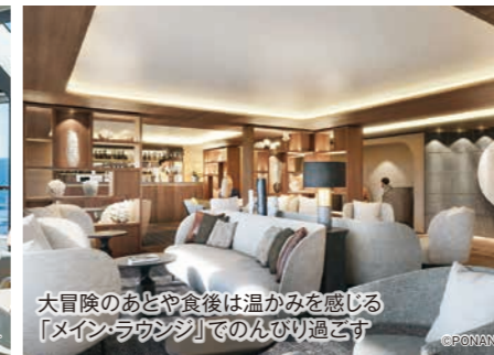
大冒険のあとや食後は温かみを感じる「メインラウンジ」でのんびり過ごす