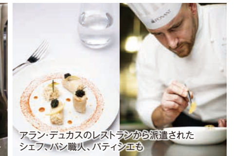
アラン・デュカスのレストランから派遣されたシェフ、パン職人、パティシエも