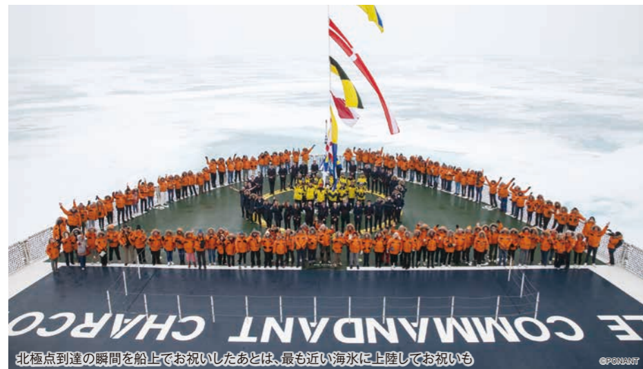
北極点到達の瞬間を船上でお祝いしたあとは、最も近い海水に上陸してお祝いも

世界最北の都市、ノルウェー領スピッツベルゲン島のロングイヤービエンから豪華客船に乗船します。険しい山々に氷河が流れ込む光景を望みながら北へ突き進むと、氷が海を埋め尽くす、凍った世界へ。船は海水を割ながら滑るように進み、恒常的な目印のない北極点を探すように航海し、北極点に到達。地球のてっぺんに立つ感動をお届けします。