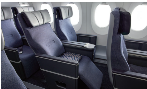
【プレミアムエコノミークラス】