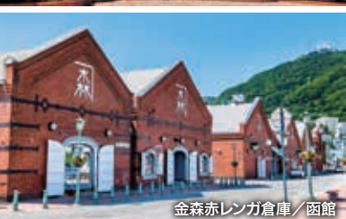
金森赤レンガ倉庫/函館