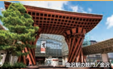
金沢駅の鼓門/金沢