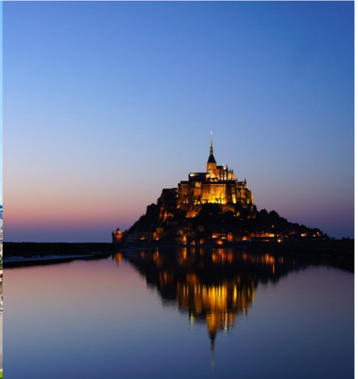
▲夕暮れ時、ライトアップされたモン・サン・ミッシェルが水面に浮かび上がる(右)