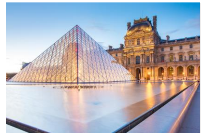
▲ガイド同行で必見の作品を効率よくご覧いただけます