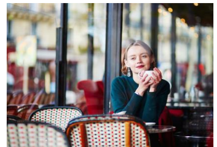
▲おすすめカフェやお買い物も現地在住ガイドにおまかせ