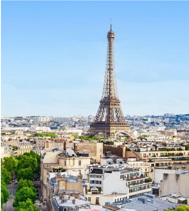
▲パリの街にそびえ立つエッフェル塔(左)