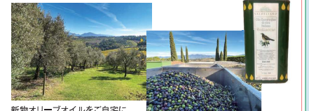
新物オリーブオイルをご自宅に

★ローマの路地裏にひっそりと佇む、古き良きチョコレート工場「Moriondo e Gariglio(モリオンド・エ・ガリリオ)」。家族経営で、イタリア統一後にサヴォイア王室御用達のチョコレート職人としてロイヤルファミリーとローマに移り、1870年に創業。日本では手に入らない、秋限定商品をお土産にご用意します。イタリアのグルメ&ワインの専門誌「ガンベロロン」掲載店。(Cコース)