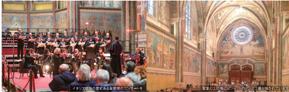
イタリア屈指の歴史ある聖歌隊のコンサートを