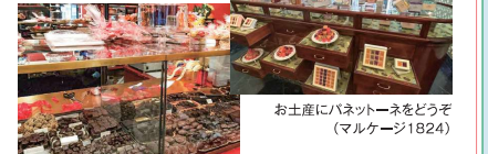
お土産にパネットーネをどうぞ (マルケージ1824)