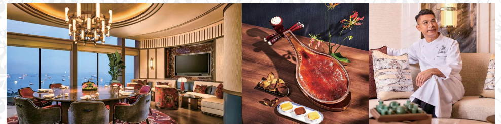
ホテルタワー1の55階に位置する。内装は宋の時代からインスピレーションを得たクラシックな雰囲気

2025年7月に誕生した広東料理店。伝統料理の技法と革新的なアイデアが融合した料理が評判を呼んでいます。