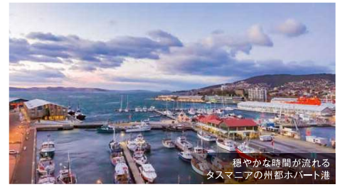
穏やかな時間が流れるタスマニアの州都ホバート港