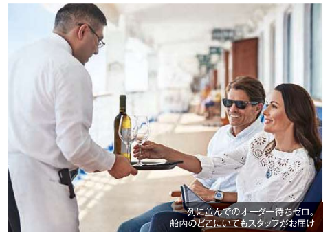
別に並んでのオーダー待ちゼロ。船内のどこにいてもスタッフがお届け