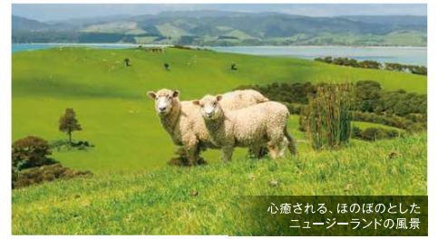
心癒される、ほのぼのとしたニュージーランドの風景