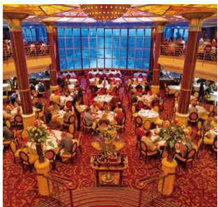
船尾に大きく窓が開けた、優雅で開放的な2層吹き抜けのメインダイニング