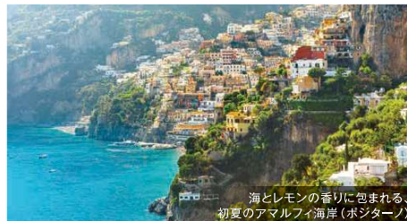
海とレモンの香りに包まれる、初夏のアマルフィ海岸(ボンターノ)