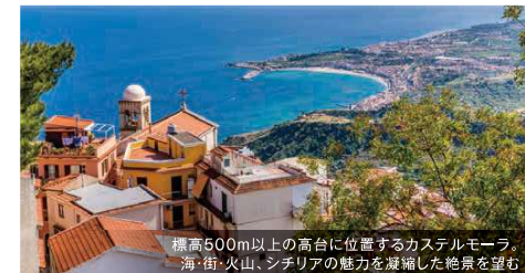
標高500m以上の高台に位置するカステルモレー。海・街・火山、シチリアの魅力を凝縮した絶景を望む