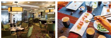
ハリウッドにレストランを構える日本人シェフ監修の創作日本料理が味わえる「スシ・オン・ファイブ」(有料)

ミシュラン3つ星レストランで腕をふるったコーネリアス・ギャラガー氏とダニエル・ブルー氏が監修する船内の料理の数々。毎日船上でパンを焼き上げ、ソースも原材料からすべて手作りのものを使用するなどのこだわりよう。複数のソムリエが乗船しお客さまそれぞれのお好みに合わせたワインも提供しています。