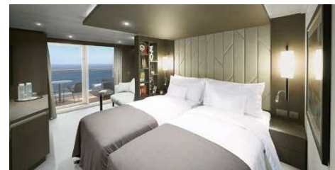
オーシャンテラススイート バルコニー・シャワー付客室 広さ約35㎡

※いずれの客室もツインベッド、テレビ、衣装箱、電話、金庫、スリッパ、ミニバー、ドライヤー、空調を備えています。