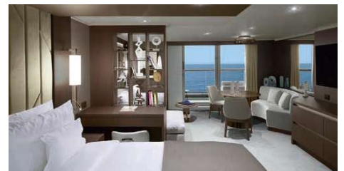
プレミアpentハウス バルコニー・シャワー付客室 広さ約52㎡