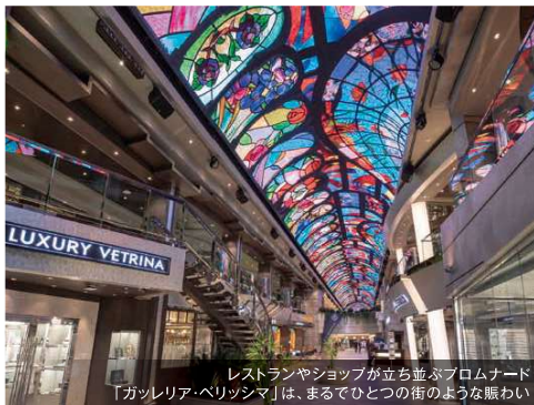
レストランやショップが立ち並ぶプロムナード「ガッレリア・ベリッシマ」は、まるでひとつの街のような賑わい

ひとつの街のような船内は、多彩な設備やエンターテインメントが充実。また、日本語の船内新聞やレストランメニューで外国船でも安心して洋上ライフを満喫できます。東京へ向かう2日間の終日航海もあり、気軽に「海外旅行」気分を味わいながら非日常体験をお楽しみください。