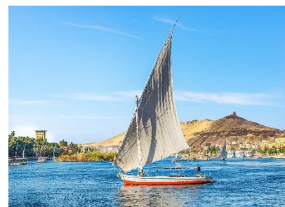
▲貸切帆船でのナイル河クルーズは忘れられないひととき