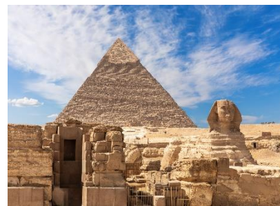
▲観智の結晶 ギザのピラミッドとスフィンクス

東京営業所 個人旅行窓口 TEL 03 (3274) 5822 営業時間 (9:30~17:30/休業日:土・日・祝日) 〒103-0022 東京都中央区日本橋室町1-2-4 三越SDビル8階