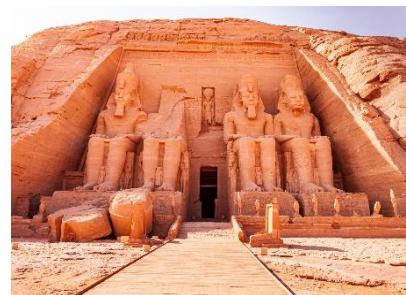
▲「アブシンベル神殿」は水没を免れた感動の世界遺産