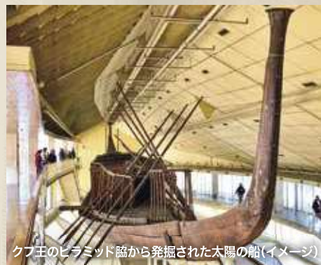
クフ王のピラミッド脇から発掘された太陽の船(イメーン)