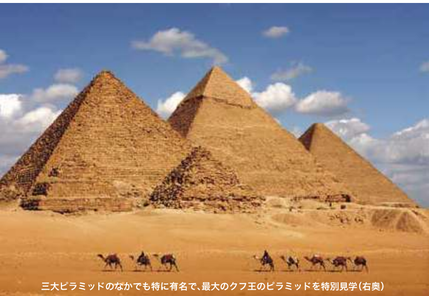
三大ピラミッドのなかでも特に有名で、最大のクフ王のピラミッドを特別見学(右奥)

いまだに誰が、どのように、なぜつくったのかなど多くの謎が残るピラミッド。一般公開の時間帯は大勢の観光客で大変な混雑となり、ガイドによる内部での説明は許可されていません。今回、この歴史的建造物を貸切り、当社のお客さまだけでピラミッドを独占。混雑がないなか、ガイドが内部まで同行できるため、より詳しい解説を聞くことが可能です。