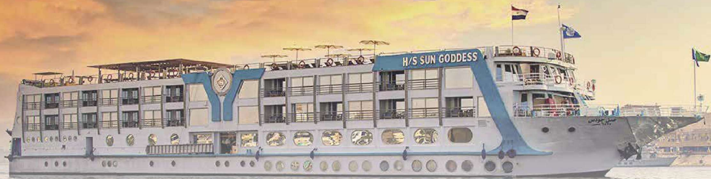
ソネスタ・サン・ゴッデス号

スイート客船に生まれ変わったソネスタ・サン・ゴッデス号は、数多くあるナイル河クルーズ船のなかでも珍しいエレベーター付きの5つ星 (※) 高級客船です。客室は約40㎡の全室スイート仕様となっており、一般的なナイル河クルーズ船の客室の約2倍に相当します。日本人には嬉しい浴槽付きで、広い客室や全室に付いたプライベートバルコニーからは、椅子に座ってゆったりとナイル河の景色を堪能できます。客船の快適さこそが、ナイル河クルーズを楽しむ最大のポイントです。