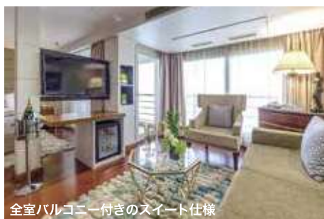
全室バルコニー付きのスイート仕様

●バスタブ(浴槽) ●シャワー ●洗面台 ●エアコン ●ドライヤー ●テレビ ●ミニバー ●電話 ●トイレ ●椅子付バルコニー ●WiFi