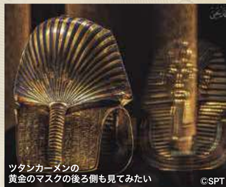
ツタンカーメンの黄金のマスクの後ろ側も見てみたい