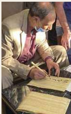
古代象形文字ヒエログリフ講座も