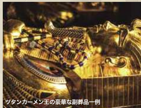
ツタンカーメン王の豪華な副葬品一例