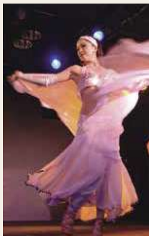
ベリーダンスショーを開催

ツタンカーメン王の眠る「王家の谷」での特別観光にあたり、船内でツタンカーメン講座を開催。発見時のエピソードなどを、最新情報を交えてご紹介します。またベリーダンスのほか、エジプトの伝統的な旋回舞踊タンヌーラショーも見ごたえがあります。