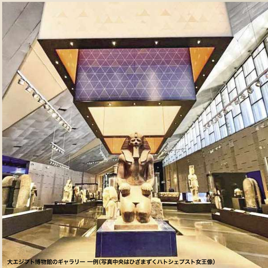
大エジプト博物館のギャラリー 一例(写真中央はひざまずくハトシェブスト女王像)

博物館の観光は、館内レストランでの昼食を挟み、約3時間30分(9:30~11:30頃/13:30~15:00頃)を予定しています。その後、ホテルに戻り休憩いただくこともできますし、ご希望の方は、さらに閉館までの約2時間(15:00~17:00頃)ほどの、自由見学も可能です。ギザにご宿泊のため、ホテルまでも近くゆっくりとご見学時間が確保できます。