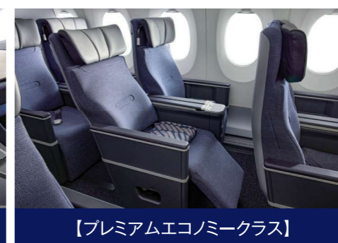
【プレミアムエコノミークラス】

【ビジネスクラス】 ・フラットベッドにもなる、シェル型で個性的なデザインの コリンズ社製シートAirLounge ・マリメッコ社製のアメニティキット