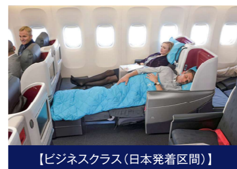
【ビジネスクラス(日本発着区間)】