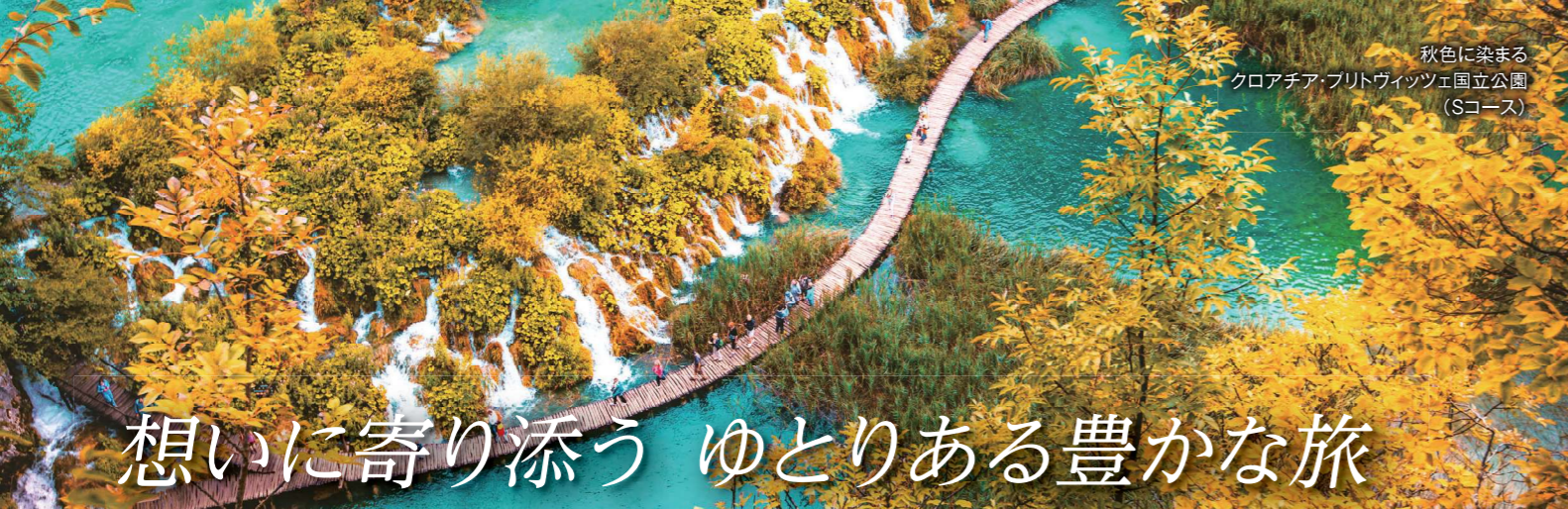
秋色に染まる クロアチア・プリトヴィツェ国立公園 (Sコース)