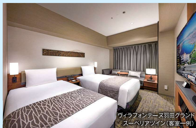
ウィラフォンテーヌ羽田グランド スーペリアツイン(客室一例)

国際線の出発が午後1時までのツアーは、空港近くのホテルで前日宿泊(朝食付)。翌朝は安心して空港へ。(該当コースは、各コースのツアースケジュールに記載しています)ご利用予定ホテルは、P55をご覧ください。前泊が不要の方には、1万円をご返金いたします。