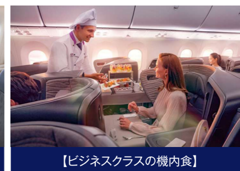
【ビジネスクラスの機内食】

【ビジネスクラス】 ・日本発着区間は全長198cmのフルフラットベッド ・マッサージ機能付き座席