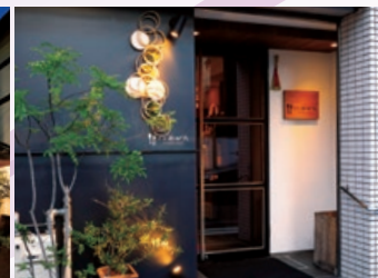
下鴨茶寮 × 洋食おがた