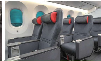
【プレミアムエコノミークラス】