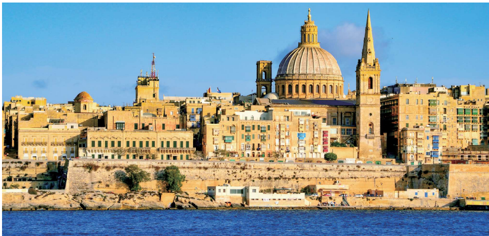
マルタ島バレッタ城塞都市(Bコース)

ウィーン・フィルの第九に酔いしれ、台北の夜空を彩る壮大な花火の競演に心を躍らせるひと時。石灰岩の奇岩が織りなすハロン湾の静謐な朝日、天空に舞うオーロラに包まれる神秘の大晦日、ヒマラヤの峰々が紅く染まる初日の出——それぞれの地でしか出あえない瞬間が、新年の幕開けをいっそう印象深くしてくれます。