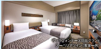
ヴィラフォンテーヌ羽田グランドスーペリアツイン(客室一例)

国際線の出発が午後1時までのツアーは、空港近くのホテルに前日宿泊(朝食付)。翌朝は安心して空港へ。(該当コースは、各コースのツアースケジュールに記載しています)前泊が不要の方には、1万円をご返金いたします。