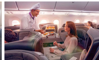
【ビジネスクラスの機内食】