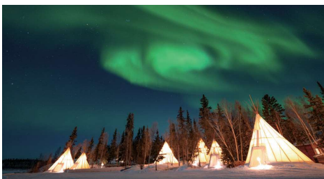
イエローナイフのオーロラビレッジで4回のオーロラ観賞(Cコース)