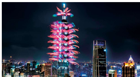
新年を祝う台北の大花火(Gコース)

※掲載する画像は、すべてイメージをより深めていただくためのもので、実際のツアーで訪問する場所、日照角度および天候を保証するものではありません。 ※掲載内容は、2026年3月20日現在のものです。