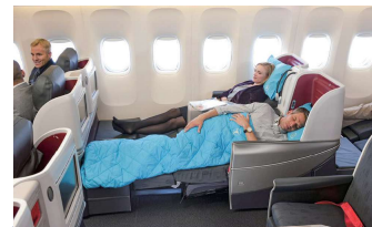
【ビジネスクラス(日本発着区間)】