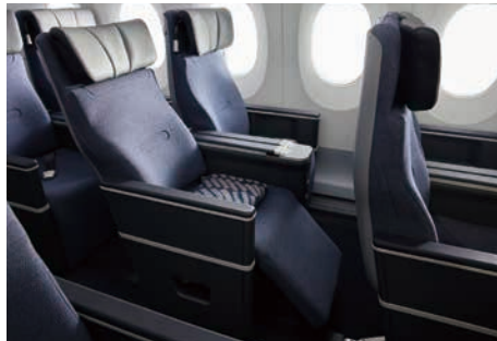
プレミアムエコノミークラス